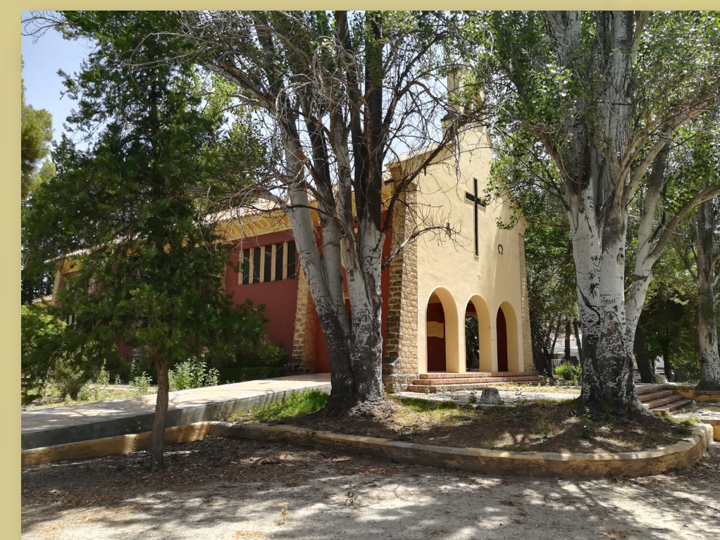
Iglesia de la Inmaculada, del siglo XX

Atención: conviene llevar calzado (o zapatillas) y vestimenta adecuados, agua y comida, así como bloc de notas, cámara fotográfica, etc. Infórmese de las previsiones meteorológicas.