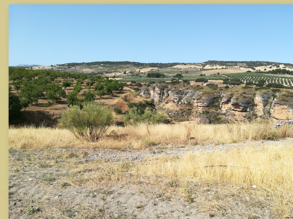
Vista de los Tajos de los Bermejales